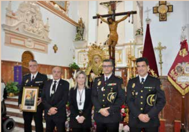
Policía Nacional de Motril por su gran labor para salvaguardar la seguridad en la Semana Santa de Motril